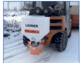
POLARO® 170 šakiniui krautuvui su sniego dozatoriumi