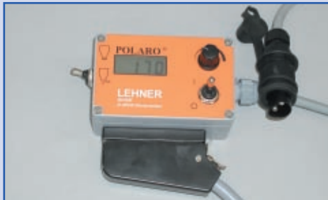
Nuotolinio valdymo pultas