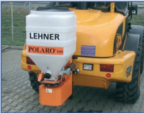
POLARO® 100 prie ratinio traktoriaus