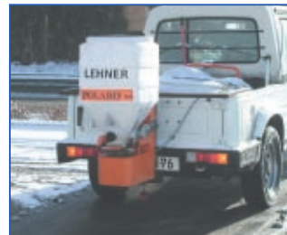
POLARO® 100 pikapui su sniego dozatoriumi