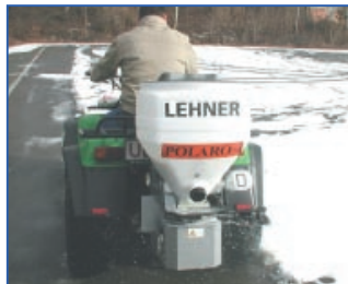
POLARO® 70 automobiliui su sniego dozatoriumi