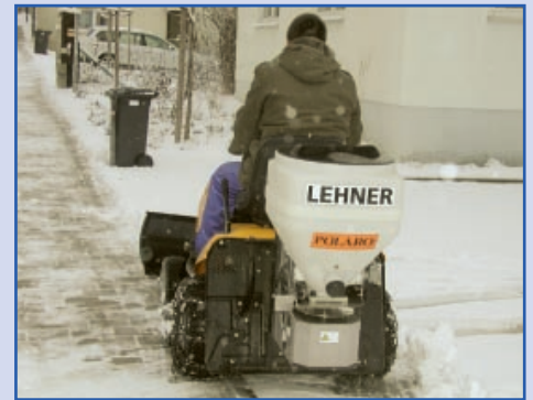
POLARO® 70 keturračiui su sniego dozatoriumi

Su POLARO® galima bastyti tokius bastomas medžiagas kaip druska, smulkus žvyras, smėlis ir trąšos be specialių transporto priemonių.