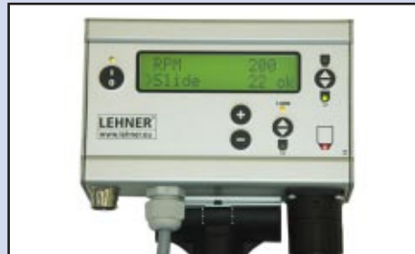
Nuotolinio valdymo pultas